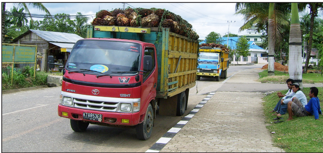
Fig. 3: Trucks loaded with oil palm fruit in Tanah Grogot

to the local population to replant 20,000 hectares of oil palm, including the 2,400 hectares claimed in the PTPN Sawit Indonesia case, and 10,000 hectares of rubber trees under a population plantation ( kebun rakyat ) scheme intended to prevent further conflict and stimulate stability in the district. 18 The tatapraja division was found to be an ideal vehicle both for monitoring the implementation of these and other, private, new plantation projects. Three officials on its staff, an ethnic Paserese and two migrants, were specifically tasked with preventing new conflicts and solving those still in existence. A demanding and sensitive task, as the following example illustrates.