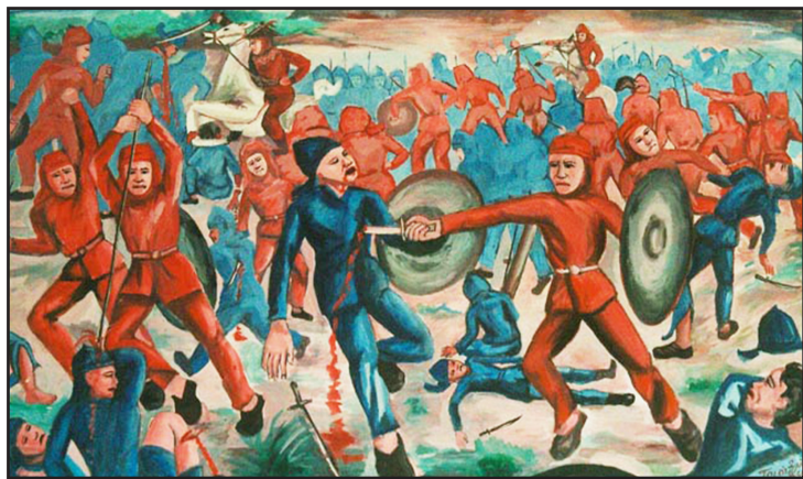
Abb. 3: Ölgemälde im Provinzmuseum von Champasak (Pakse)

Mayoury und Pheuiphahn, dass das Aufbegehren Chao Anuvongs schlecht vorbereitet, chaotisch und selbstmörderisch war – also alles andere als ein ruhmreiches historisches Kapitel. Nimmt man jedoch, so wie es die LRVP-Geschichtsbetrachtung tut, Elemente wie